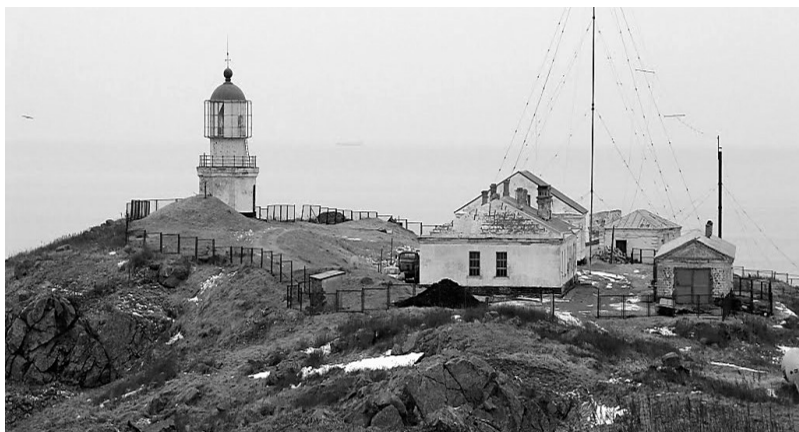
Рисунок 1. Маяк на мысе Поворотном

К 1941 г. в дополнение к световым маякам, построенным до революции, Гидрографическим отделом ТОФ совместно с военными строителями были выстроены маяки на ключевых мысах дальневосточного побережья – Чихачева, Егорова, Балюзек, Золотой, Песчаный, Елизаветы, Лопатка. Была сооружена сеть светящихся знаков на временных сооружениях. В 1934 г. был введен в действие первый радиомаяк типа РСМ-3 при маяке Поворотный (рис. 11), а к 1941 г. безопасность кораблевождения обеспечивали уже более двадцати радиомаяков типа РСМ-3, РСМ-3М, РСМ-4.