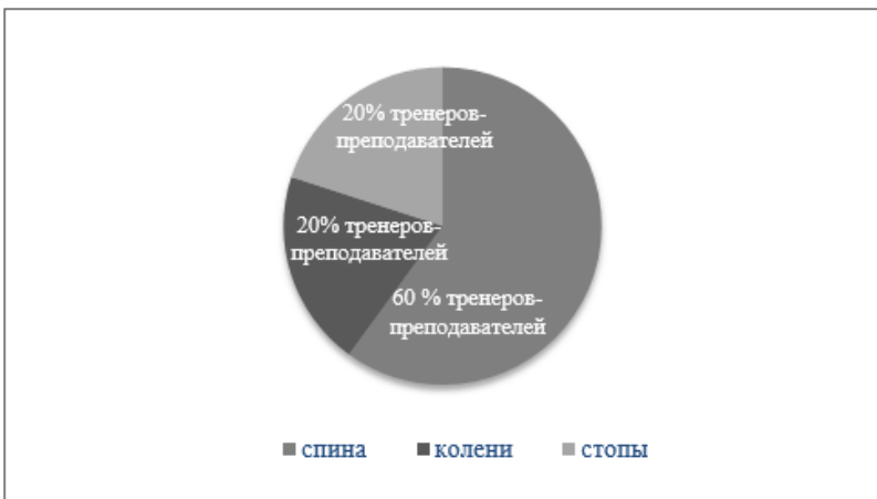
Рисунок 2. Области тела, которые чаще всего, по мнению тренеров-преподавателей, подвергаются травмам

2 тренера из 10 не сталкивались с травмами в процессе тренерской деятельности. Все тренеры выполняют растяжку на тренировках, чтобы уменьшить риск получения травмы. Большинство тренеров умеют оказывать первую помощь при растяжениях и переломах. 90 % специалистов считают, что массаж – это неотъемлемая часть профессионального спортсмена, что массаж нужен обязательно и не только перед соревнованиями, а после каждой тренировки. Лишь 10 % утверждают, что массаж не обязателен, когда нет важных соревнований и, что массаж лучше делать только перед соревнованиями для того, чтобы в ответственный момент спортсмен не получил серьезную травму.